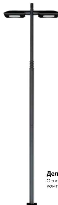
Делоникс Сквеа Осветительный комплект