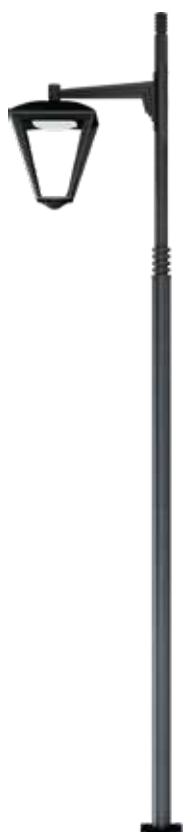
Делоникс 1D Осветительный комплект