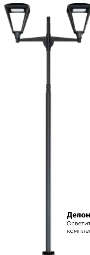
Делоникс 2U Осветительный комплект